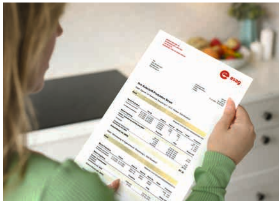
Vierteljährliche Abrechnung durch die ESAG.

Die ESAG erfasst den Strom, der durch Ihre PV-Anlage erzeugt wird, und verteilt ihn entsprechend dem individuellen Stromverbrauch der EVG-Teilnehmenden basierend auf 15-Minuten-Messwerten. Die Abrechnung der Strombezüge – sowohl aus der Photovoltaikanlage (PV-Anlage) als auch aus dem Netz – erfolgt vierteljährlich direkt zwischen der ESAG und den EVG-Teilnehmenden.