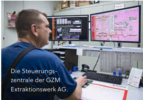
Die Steuerungs- zentrale der GZM Extraktionswerk AG.

Ein zentraler Aspekt von Kreislaufwirtschaft (siehe Thema) ist die Steigerung von Effizienz, wie etwa beim Einsatz von Fernwärme. Wärme, die als «Abfallprodukt» in einem industriellen Prozess entsteht, verpufft dabei nicht in der Atmosphäre, sondern dient dem Heizen – oder via Absorptionsverfahren auch der Kühlung.