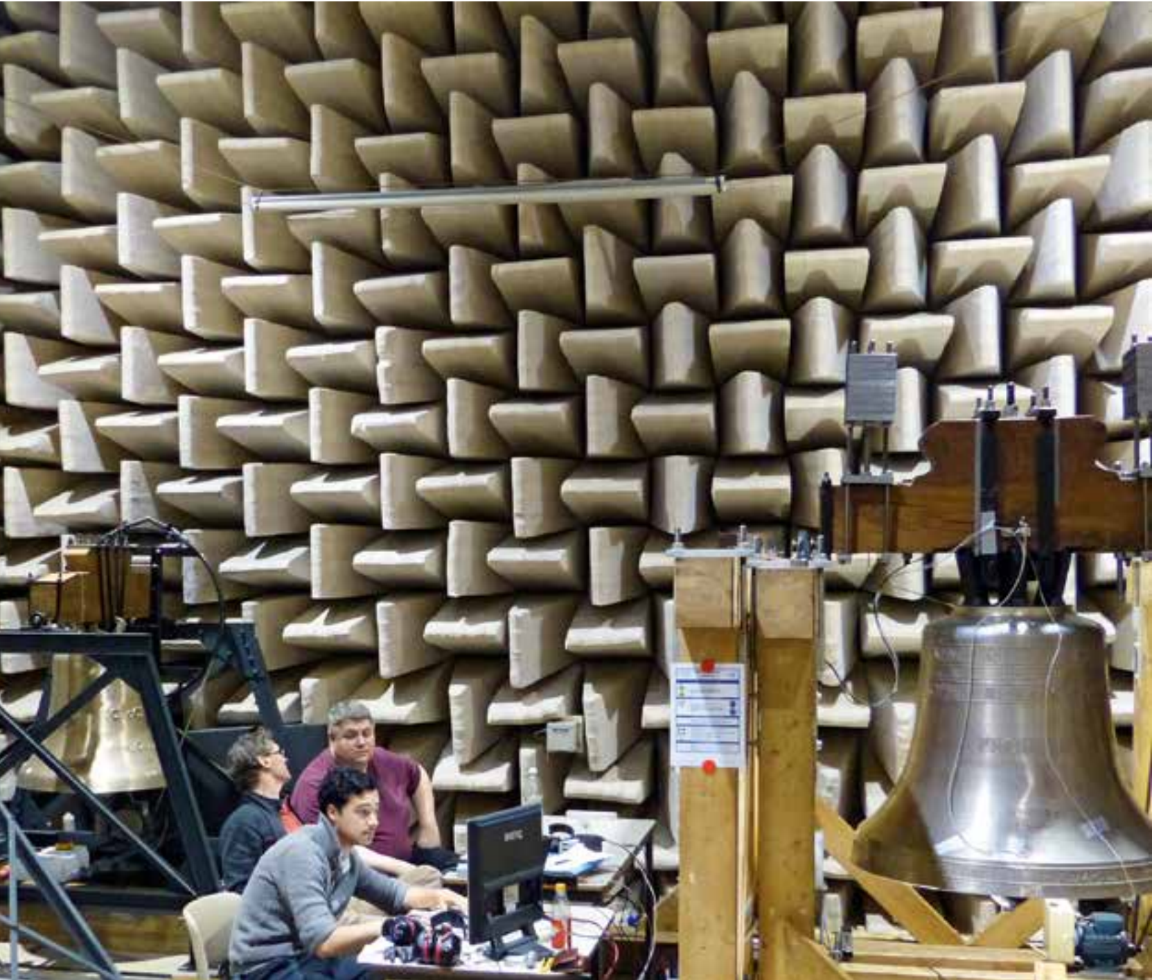
Neue Zeiten: Forscher am Kompetenzzentrum ECC-ProBell messen Klangentwicklung und Materialbelastung einer Kirchenglocke. An den ProBell-Forschungsprojekten beteiligen sich regelmässig Mitarbeitende der H. Rüetschi AG.

Aus einer Giesserei in Aarau stammen über 10 000 Kirchenglocken, Armeebüchsen und Kanonen, Statuen, Brunnen, Kunstwerke.