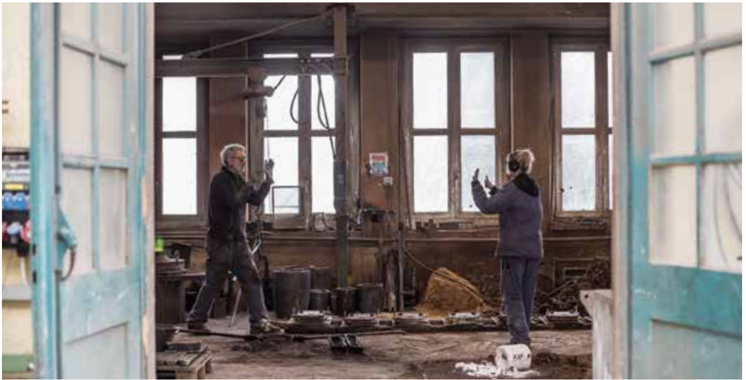
Team im Wandel: In der ältesten Giesserei der Schweiz arbeiten heute mehrere Generationen und Berufe.

Einspruch. Auf jedem seiner Unternehmensfelder habe Rüetschi Mitbewerber, oft günstigere, aus ganz Europa. Die öffentliche Hand sei häufig Auftraggeber, und da regiere der Preis. Nur rund fünf Prozent des Umsatzes mache Rüetschi heute noch mit dem Glockenguss.