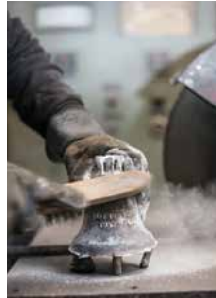
Ein Klangkörper entsteht: Der Glockenkern und die falsche Glocke bilden einen Hohlraum, in den die flüssige Bronze läuft. Nach dem Guss wird die Glocke – hier ein privates Geschenk – aus der Form befreit und in der Werkstatt bearbeitet.

Damals wie heute heisst Glocken giessen genau arbeiten. Fehler verzeiht das Handwerk nicht: Ein falscher Ton im Kirchturm würde kilometerweit gehört. Bereits nach dem Guss, wenn ein Gemisch aus Zinn und Kupfer in den Hohlraum zwischen tönernem Glockenkern und der darauf aufgesetzten «falschen Glocke» fliesst, sind die Glocken auf einen Sechzehntelton genau gestimmt. Zum harmonischen Klangkörper werden sie durch Feilen und Schleifen. Das ist schon 1367 so, als die Rebers in der noch jungen Stadt Aarau Kirchenglocken giessen. Auf sie folgen etliche Giesserfamilien – und schliesslich die Gebrüder Rüetschi, die dem Unternehmen seinen heutigen Namen geben. Und Aarau zur Glockenstadt machen.